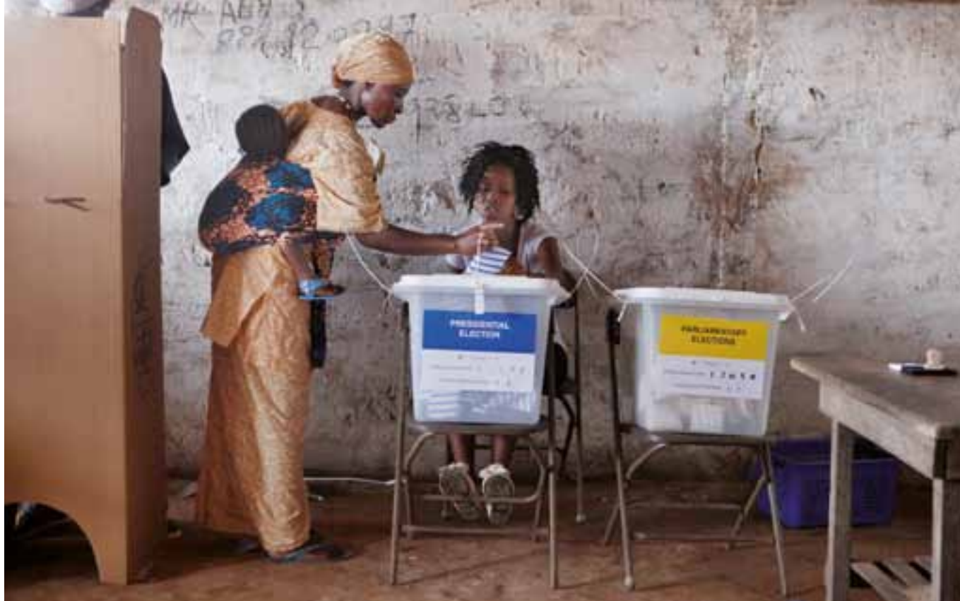
▲ Sierra Leone, 2012.