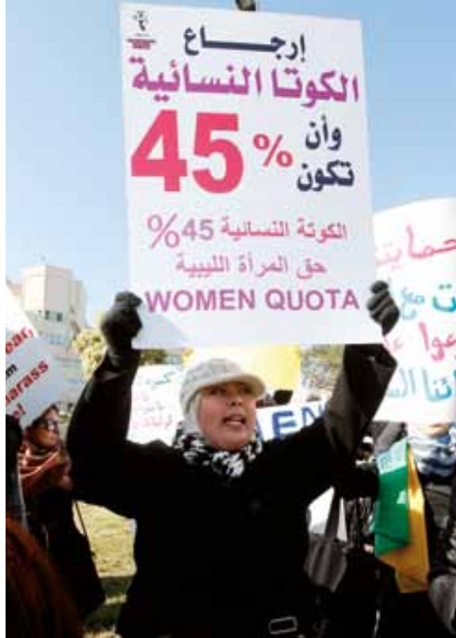
▲ Libye, 2012.

Enfin, en Egypte, malgré la réforme politique et démocratique que les citoyens appellent de leurs vœux, le nombre de femmes parlementaires est en baisse pour la deuxième année consécutive. En 2011, l'élection de la chambre basse avait vu seulement 2% de femmes sortir victorieuses du scrutin, contre 12,7% aux élections précédentes. Les élections de début 2012 à la chambre haute, le Conseil de la Choura ont, elles aussi, vu peu de femmes – 12 seulement (soit 4,4%) élues. La représentation